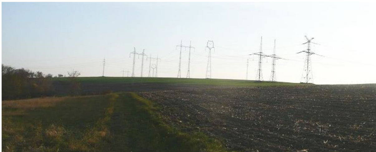
Obrázek 1.1: Pohled z polní cesty na západě obce směrem na zemědělsky využívanou krajinu s dominantou vedení VVN (IRI)