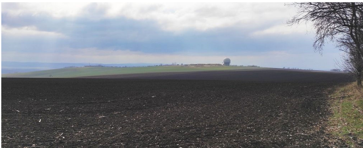
Obrázek 5.1: Pohled z polí okolo Prackého kopce na radar Sokolnice a rozsáhlé bloky orné půdy (IRI)