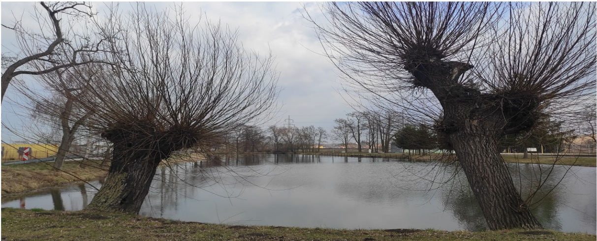
Obrázek 6.2: Pohled na Horní rybník v zastavěném území obce (IRI)