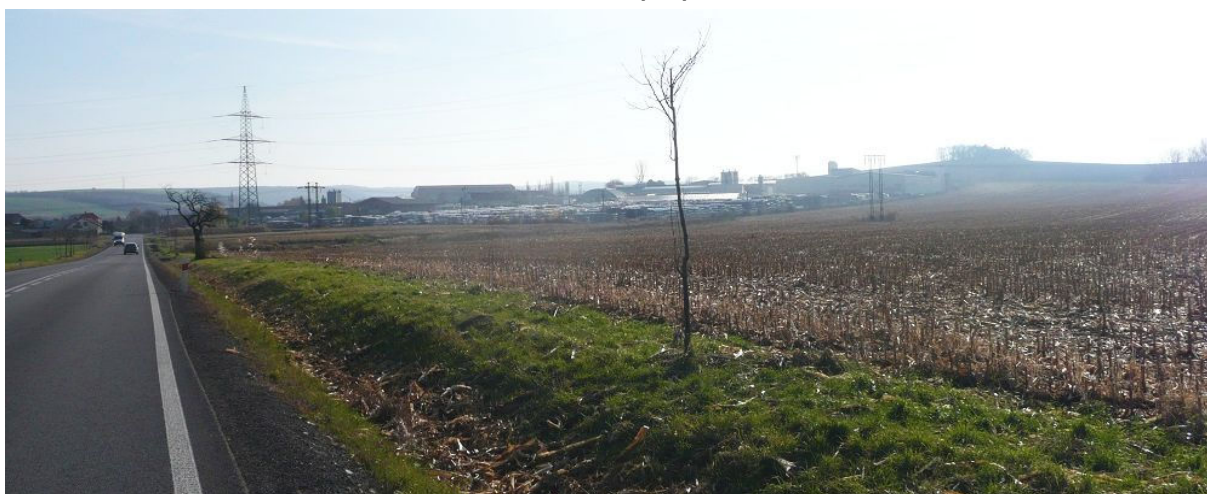
Obrázek 13.1: Pohled na výrobní haly ze silnice z Újezdu u Brna do Otnic (IRI)