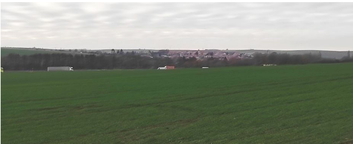
Obrázek 17.1: Pohled na Velešovice s kostelem sv. Barbory přes dálnici D1 ze silnice z Rousínova do Brna (IRI)