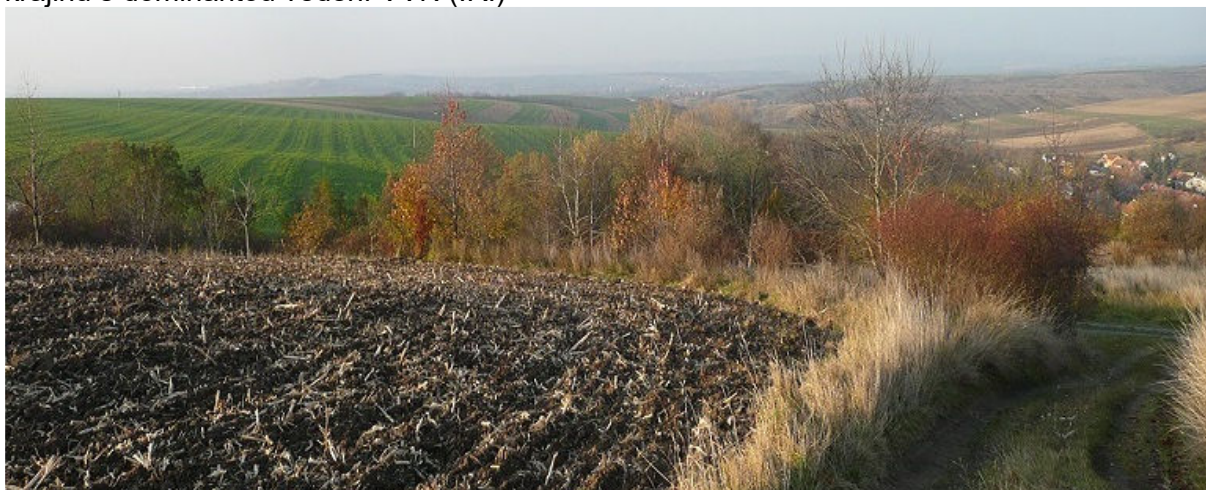
Obrázek 1.2: Pohled z polní cesty na západě obce na otevřenou krajinu a část obce (IRI)