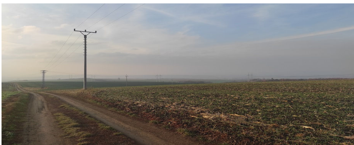
Obrázek 12.2: Pohled na rozsáhlé bloky orné půdy s vedením VVN mezi Nížkovicemi a Kobeřicemi u Brna (IRI)