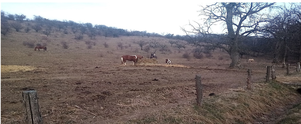
Obrázek 2.4: Výběh s koňmi ekofarmy Jalový dvůr (IRI)