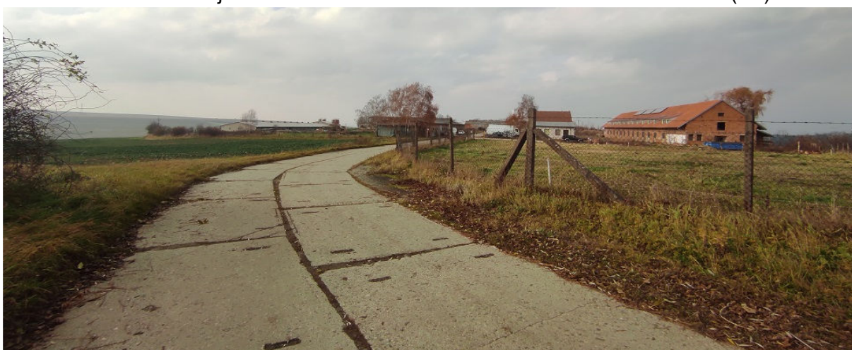
Obrázek 7.3: Pohled od obce na zemědělský areál na jihozápadě (IRI)