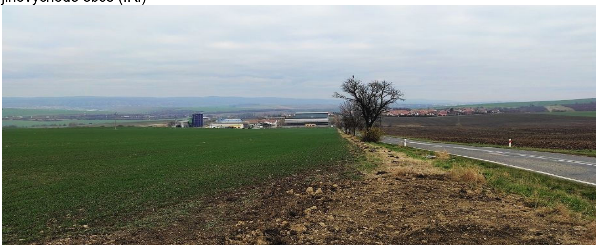
Obrázek 17.4: Pohled na areál zemědělské výroby při příjezdu do obce z jihu (IRI)