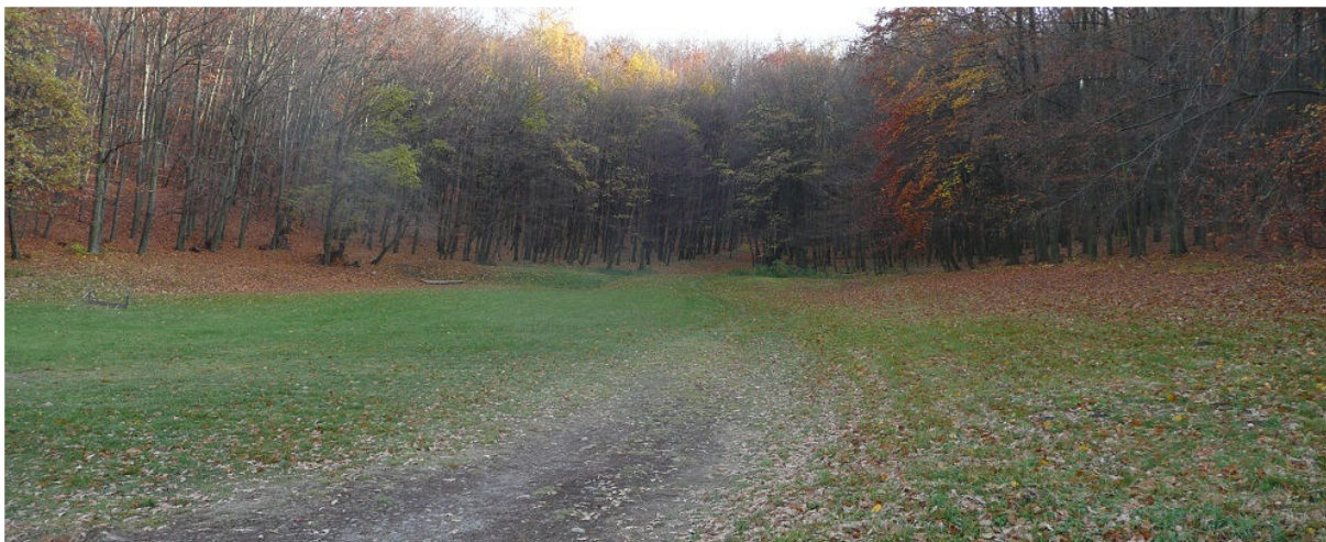
Obrázek 9.4: Vstup do Ždánického lesa na jihovýchodě obce (IRI)