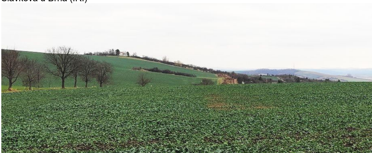
Obrázek 14.4: Výhled na kapli sv. Urbana od severního cípu golfového hřiště (IRI)