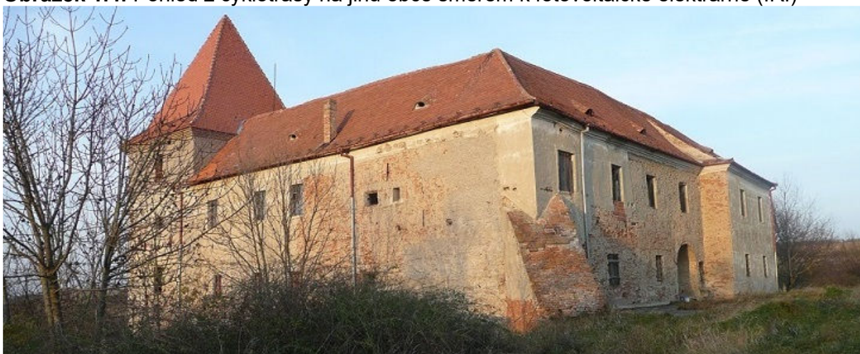
Obrázek 1.5: Tvrz Bošovice, významná dominanta v centru obce (IRI)