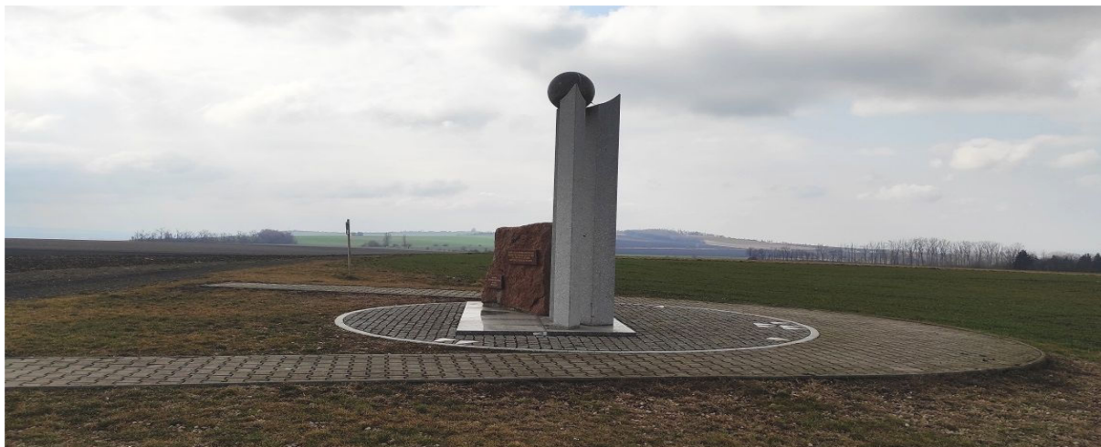
Obrázek 18.1: Pomník Tří císařů nacházející se severně od obce, v pozadí Pracký kopec (IRI)