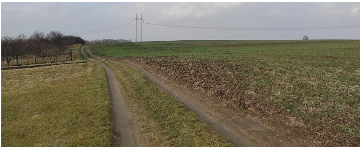
Obrázek 7.5: Polní cesta na severu směřující z obce k Dřínovému kopci, v pozadí viditelné vedení VVN (IRI)