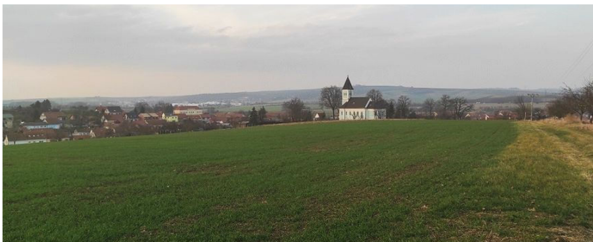
Obrázek 3.2: Pohled na Hodějice z jihu s dominantou kostela sv. Bartoloměje (IRI)