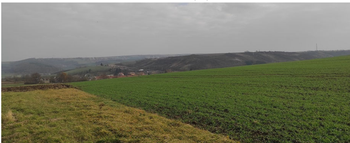
Obrázek 10.1: Pohled na obec ze silnice z Otnic přes rozsáhlé bloky orné půdy (IRI)