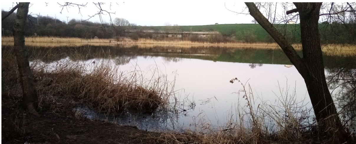
Obrázek 12.3: Pohled na rybník Kačák v obci Heršpice na hranici obce Nížkovic (IRI)