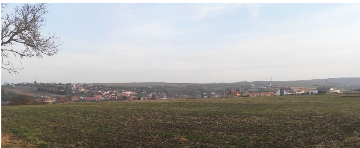
Obrázek 2.1: Pohled na zastavěné území obce s dominantou evangelického kostela ze severozápadu (IRI)