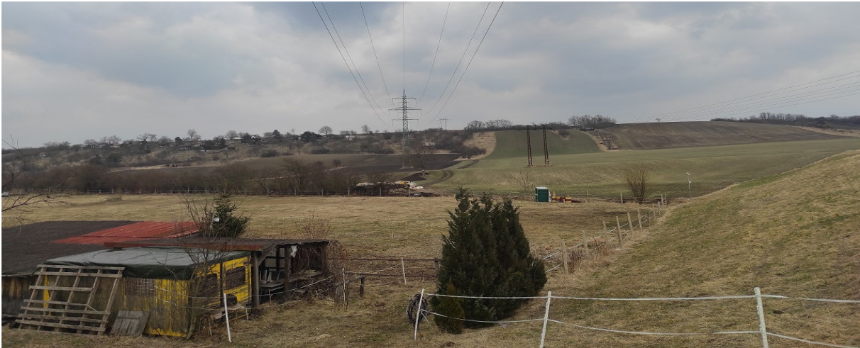
Obrázek 16.1: Výhled od božích muk do okolní krajiny na jihu obce včetně negativní dominanty vedení VVN (IRI)