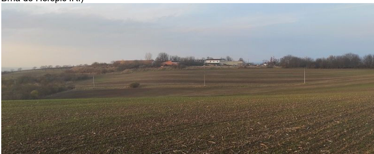
Obrázek 2.3: Pohled na autoservis na západě obce (IRI)