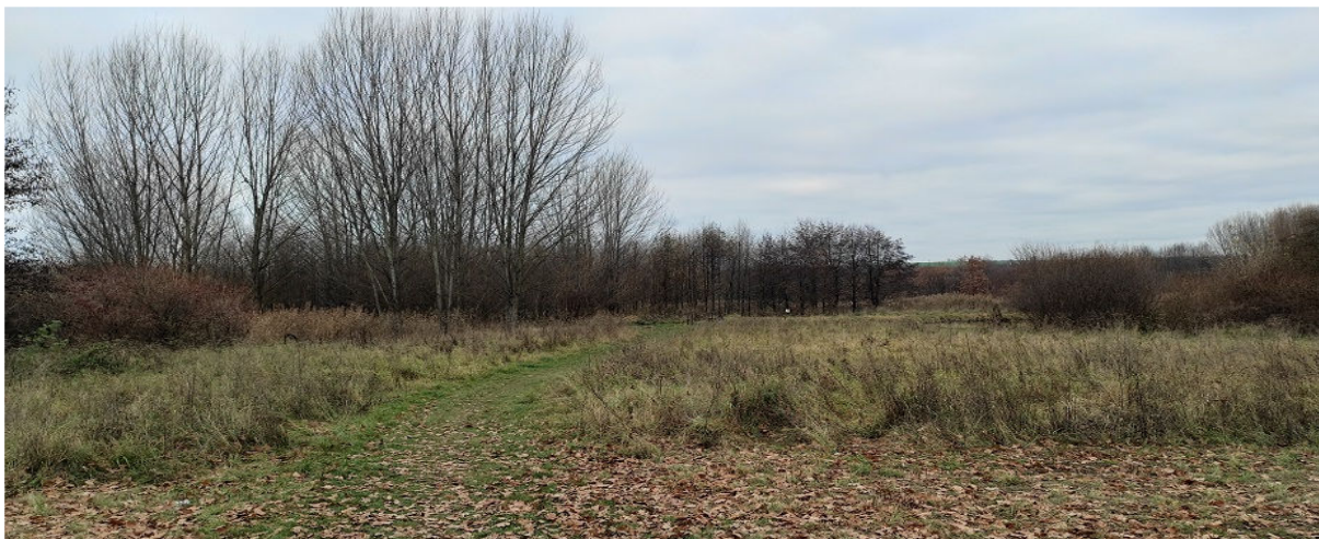
Obrázek 17.2: Vstup do krajiny u rybníků na severu obce (IRI)