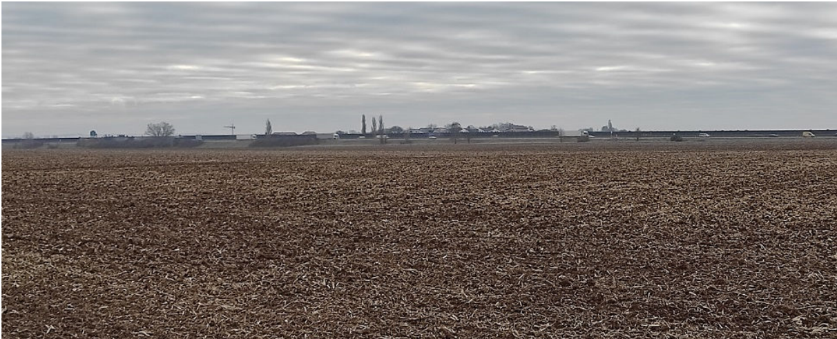
Obrázek 4.1: Pohled od silnice vedoucí do Rousínova, na dálnici D1 protínající bloky orné půdy (IRI)