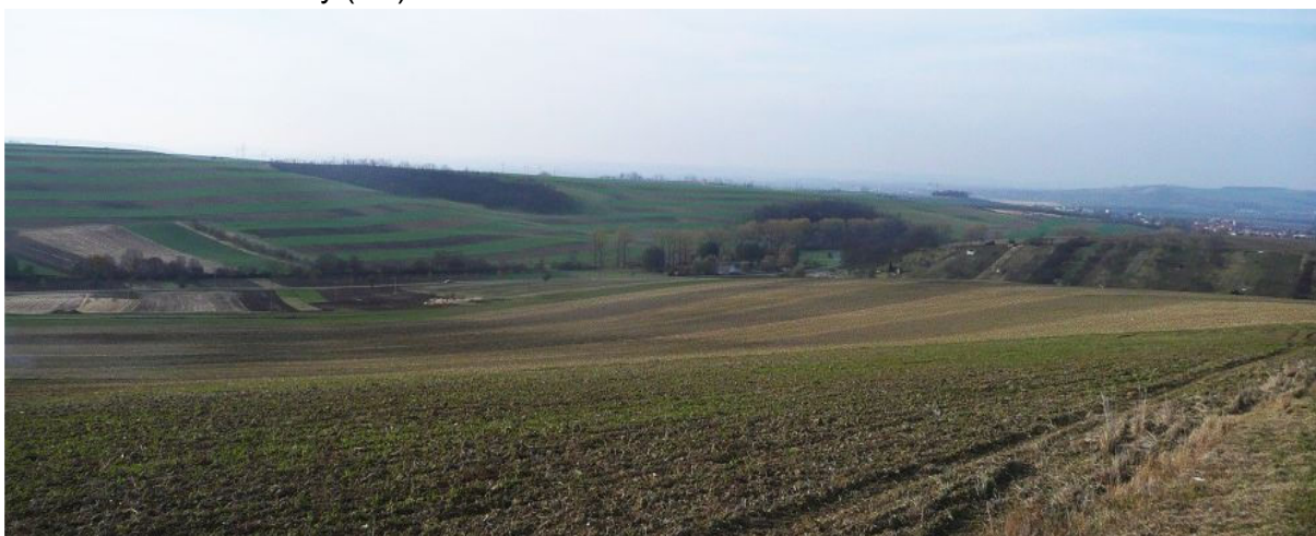
Obrázek 9.2: Pohled na pole s realizovanými protierozními opatřeními západně od obce (IRI)