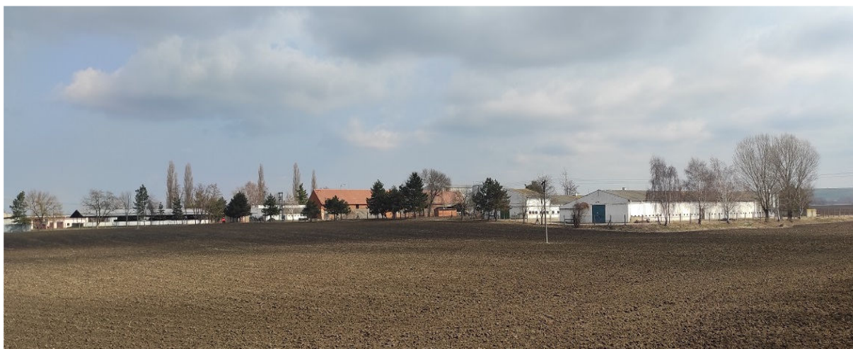
Obrázek 15.2: Pohled na haly při příjezdu do obce z jihu (IRI)