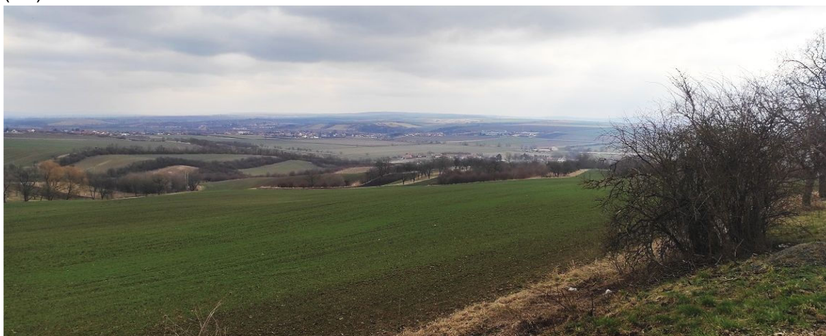
Obrázek 18.2: Pohled na krajinu nad Zbýšovem ze silnice z Blažovic s viditelným členěním polí vzrostlou zelení (IRI)