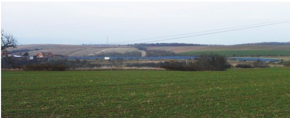
Obrázek 1.4: Pohled z cyklotrasy na jihu obce směrem k fotovoltaické elektrárně (IRI)