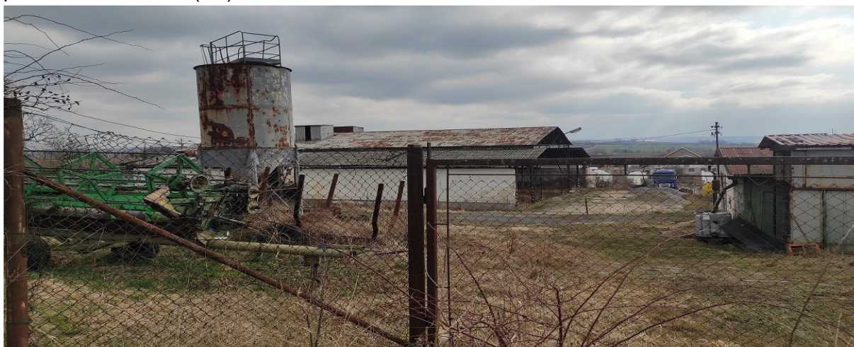
Obrázek 18.3: Pohled na zemědělský areál na jihozápadě obce při příjezdu z Hostěrádek-Rešova po železnici (IRI)