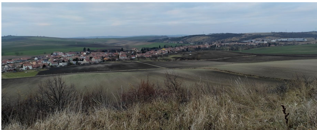
Obrázek 11.5: Pohled na Němčany z paraglidingového stanoviště na jihu obce (IRI)