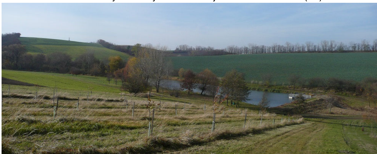
Obrázek 13.2: Výhled do krajiny od rybníka na jihu obce (IRI)