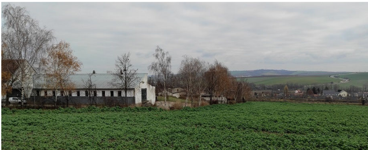
Obrázek 4.4: Výhled z jihu od hřbitova na zemědělský areál v Holubicích (IRI)