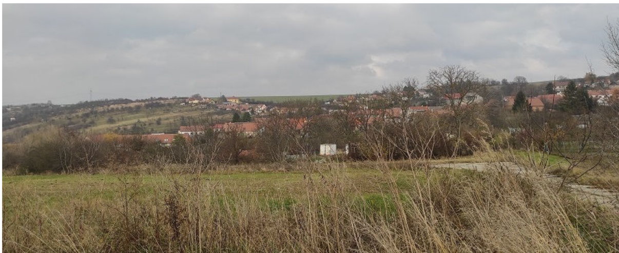
Obrázek 7.2: Pohled z jihu od zemědělského areálu na zastavěné území obce (IRI)