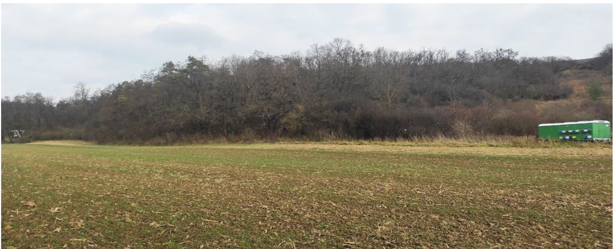
Obrázek 7.1: Pohled na přírodní památku Polámanky v západní části území obce s tradičním včelínem (IRI)