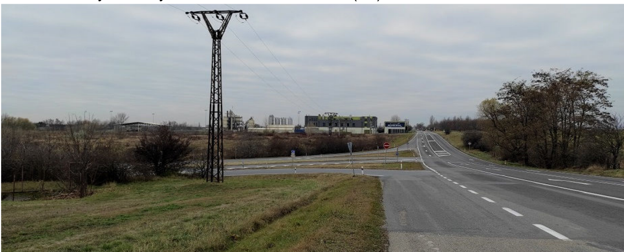
Obrázek 4.3: Pohled ze silnice II/430 směr Brno na odbočku na Holubice, v pozadí betonárna (IRI)