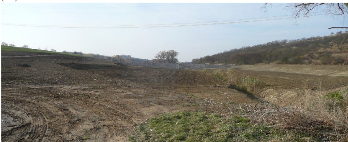
Obrázek 9.3: Pohled na realizaci stavby „Vodní nádrž rybník Neset“ na vodním toku mezi Lovčičkami a Otnicemi (IRI)