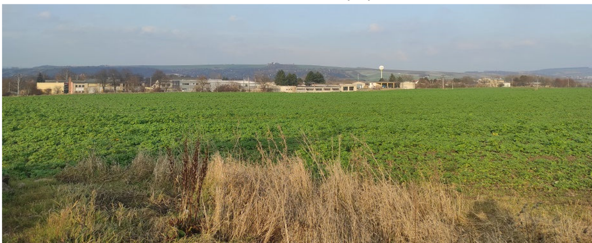
Obrázek 14.1: Pohled z jhu na město přes haly výrobního areálu s věžový vodojem (IRI)