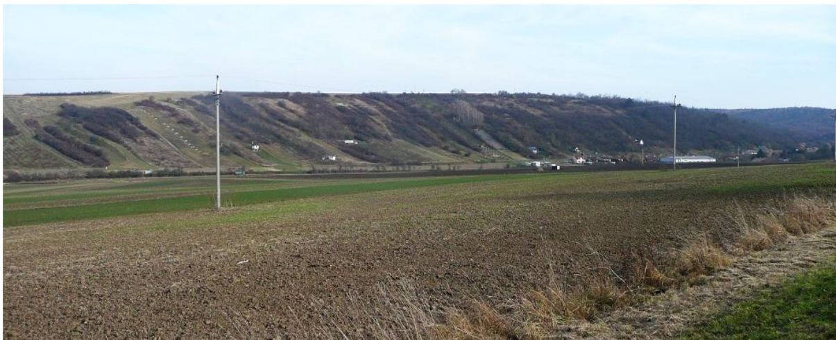
Obrázek 9.1: Pohled ze silnice z Otnic na zarostlé stráně nad Lovčičkami s viditelnou budovou stavební firmy (IRI)