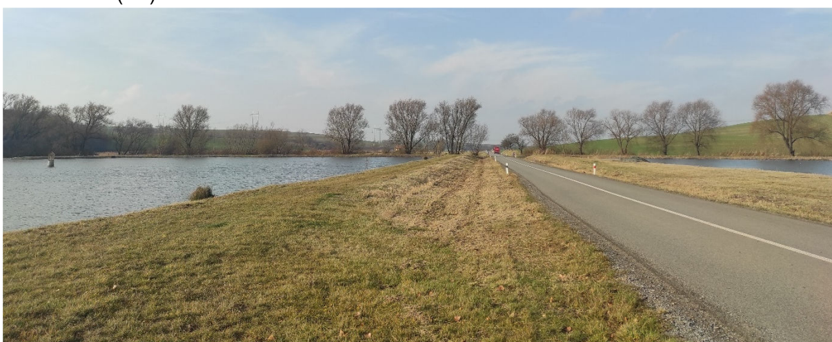
Obrázek 7.6: Pohled na krajinu s rybníky (Urbance) Šaratice – Kobeřice u Brna (IRI)