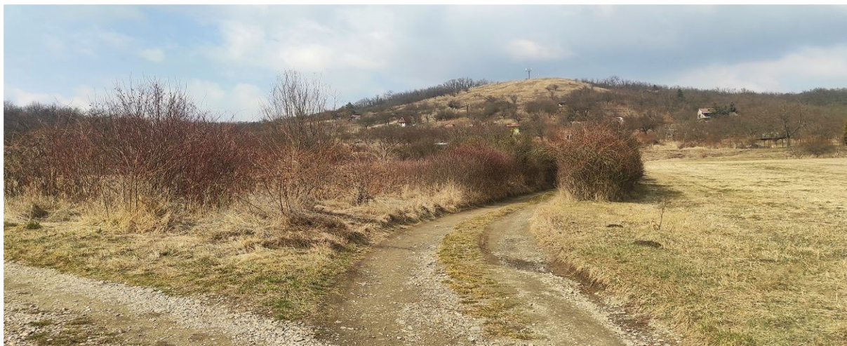
Obrázek 5.2: Výhled na Starou horu a na přírodní rezervaci Špice na hranici řešeného území (IRI)