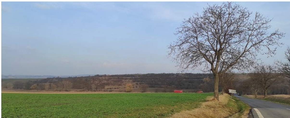
Obrázek 3.1: Pohled na kaskády ze silnice směr Slavkov u Brna (IRI)