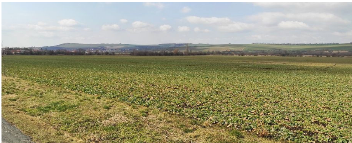
Obrázek 15.1: Výhled ze silnice z Hrušek do Šaratic směrem k Hostěrádkám-Rešovu, v pozadí radar Sokolnice a železnice (IRI)