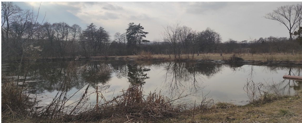
Obrázek 8.2: Pohled na rybníky při toku Rakovce na severu obce (IRI)