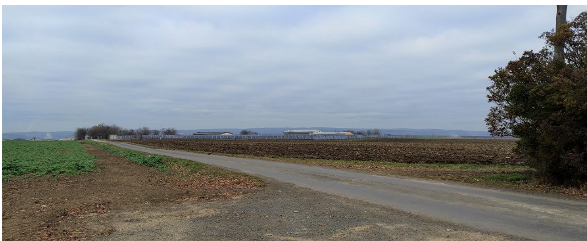
Obrázek 4.5: Pohled z jihu na fotovoltaickou elektrárnu na jihozápadě obce (IRI)