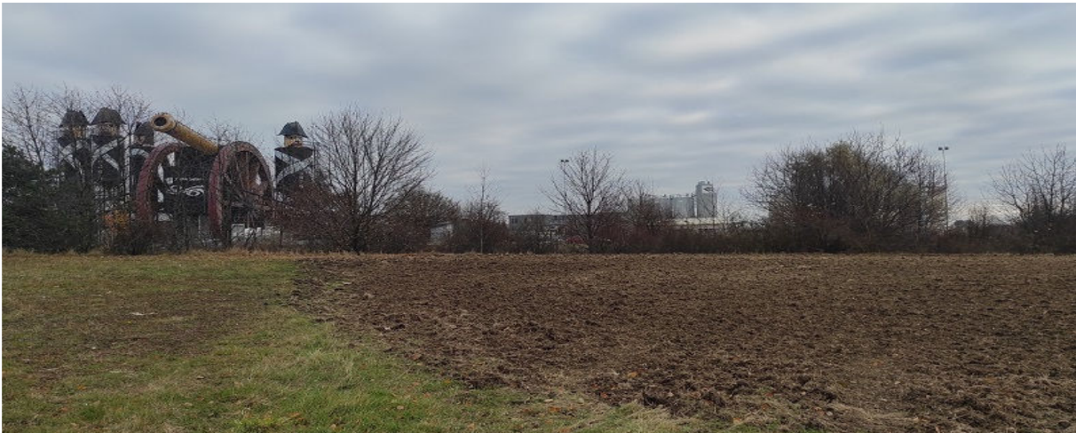
Obrázek 4.2: Pohled od Památníku obětem Bitvy tří císařů směrem k betonárně s viditelnými charakteristicky zdobenými skladovacími zařízeními (IRI)