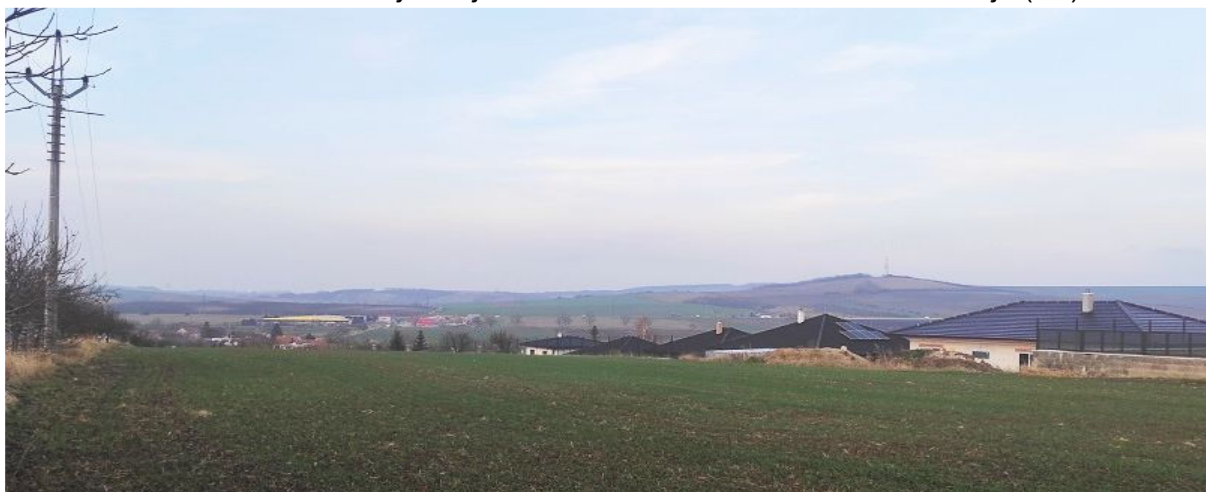
Obrázek 3.3: Pohled na Hodějice z jihu, v popředí nová výstavba, v pozadí vysílač Vinohrad (IRI)