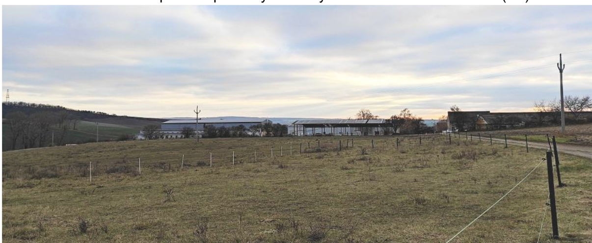
Obrázek 11.3: Pohled na obec přes haly výrobně zemědělského areálu na severovýchodě obce (IRI)