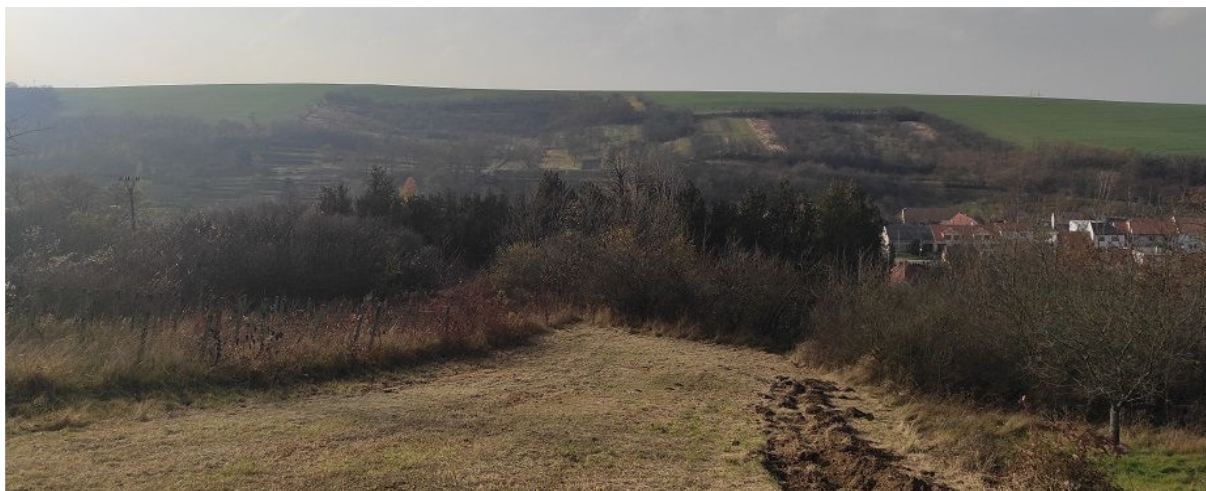
Obrázek 10.2: Pohled z východu obce nad hřbitovem do krajiny a na část obce krytou vzrostlou zelení (IRI)