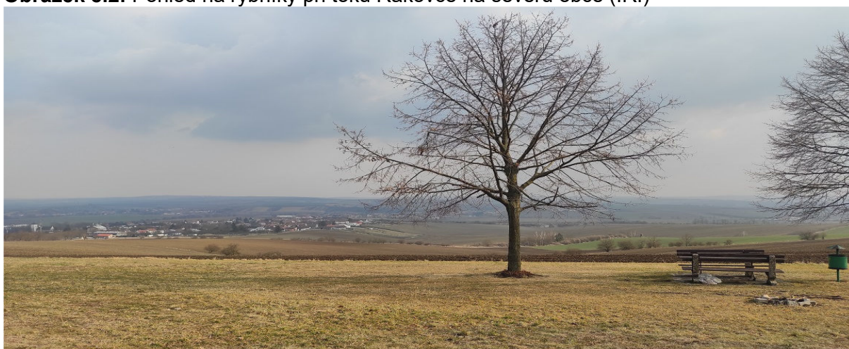
Obrázek 8.3: Posezení nedaleko pomníku Krchůvek s výhledem na Křenovice (IRI)