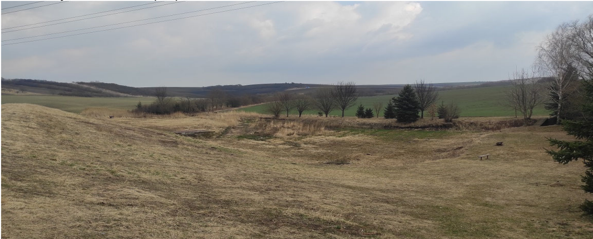
Obrázek 16.2: Bývalý rybník na jihu obce (IRI)