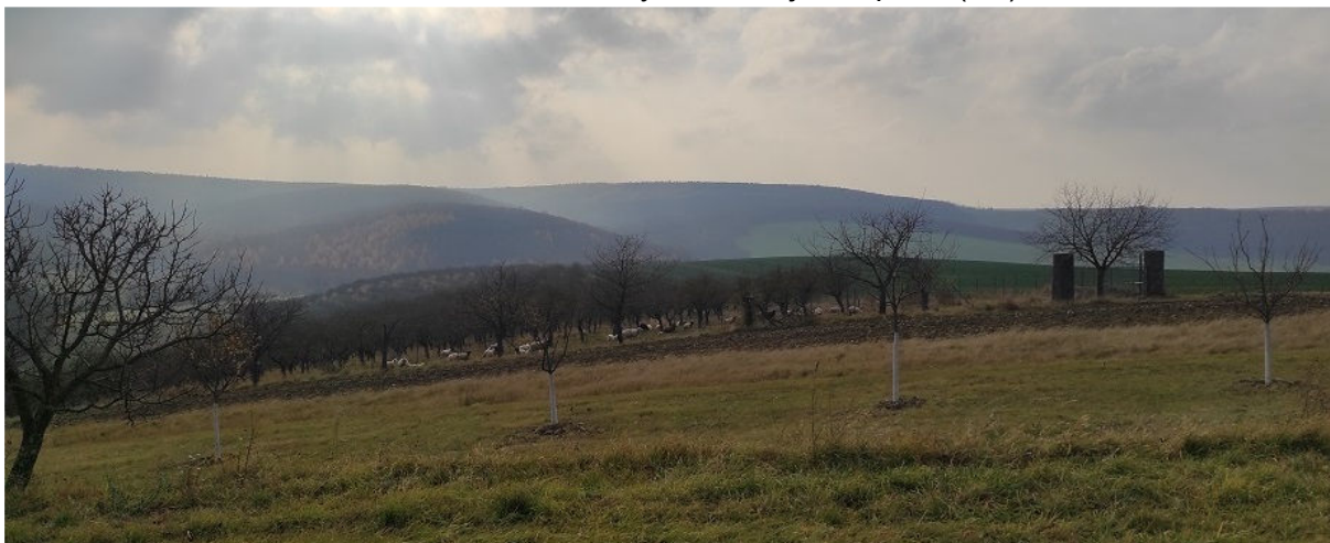
Obrázek 7.4: Výhled do krajiny z vyhlídky na jihovýchodě obce (IRI)