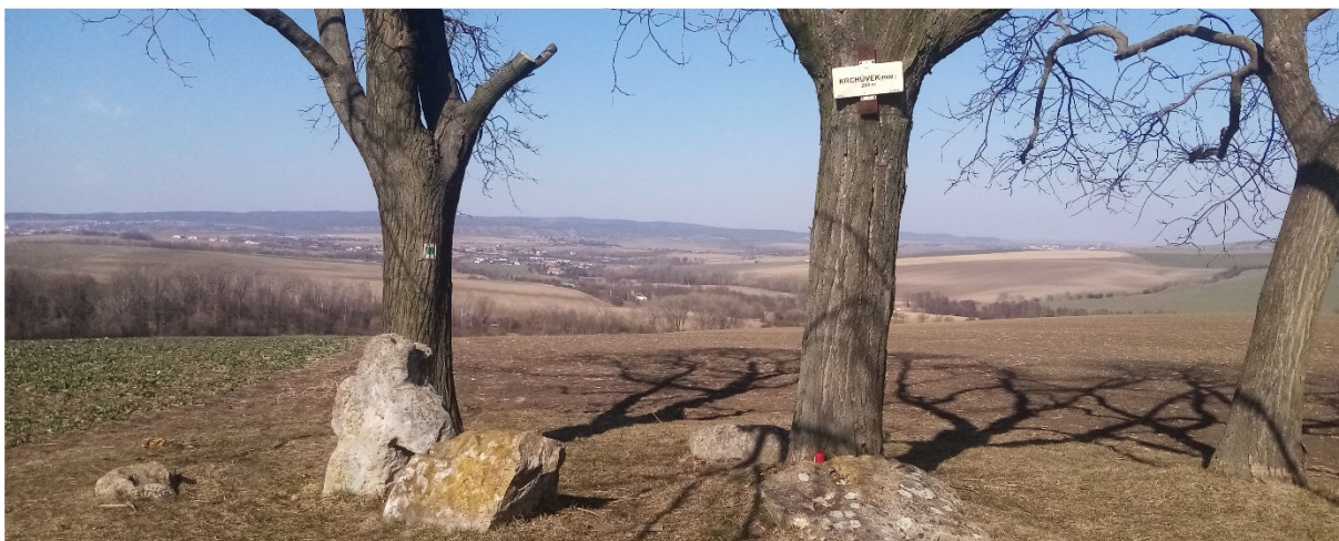
Obrázek 8.4: Vyhlídkové místo nad obcí Křenovice, u památníku Krchůvek s výhledem severně na Holubice (IRI)