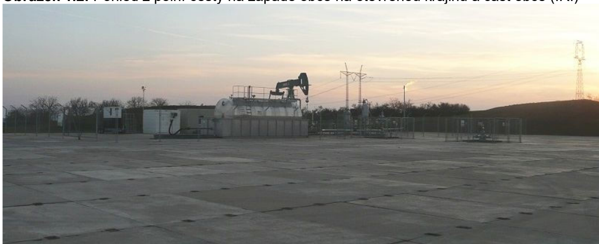
Obrázek 1.3: Vrt MND Bošovice ležící na cyklotrase na jižní hranici řešeného území (IRI)