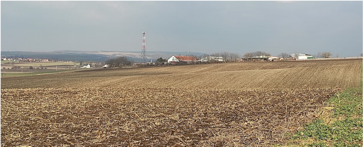
Obrázek 6.1: Pohled z jihozápadu na haly a vysílač a zvlněnou krajinu na okraji obce Hrušky (IRI)