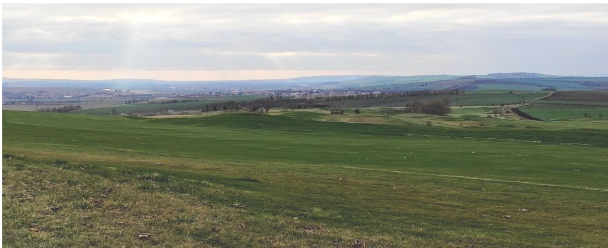
Obrázek 14.3: Pohled na město přes golfové hřiště rozkládající se severozápadně od Slavkova u Brna (IRI)