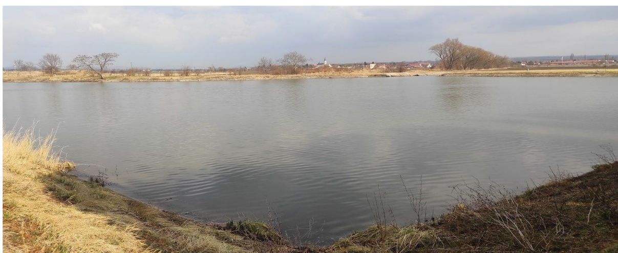
Obrázek 5.4: Pohled na Šaratice přes rybník na jihu obce (IRI)