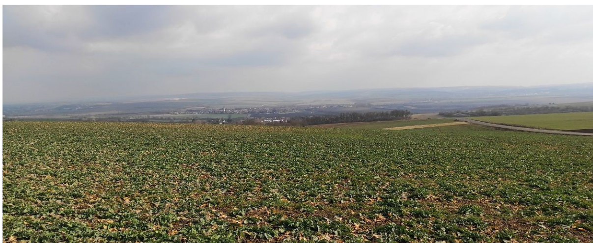
Obrázek 5.3: Výhled ze severozápadu přes otevřenou zemědělsky využívanou krajinu na v údolí schované Hostěrádky-Rešov a v pozadí viditelné Šaratice s dominantou kostela sv. Mikuláše (IRI)