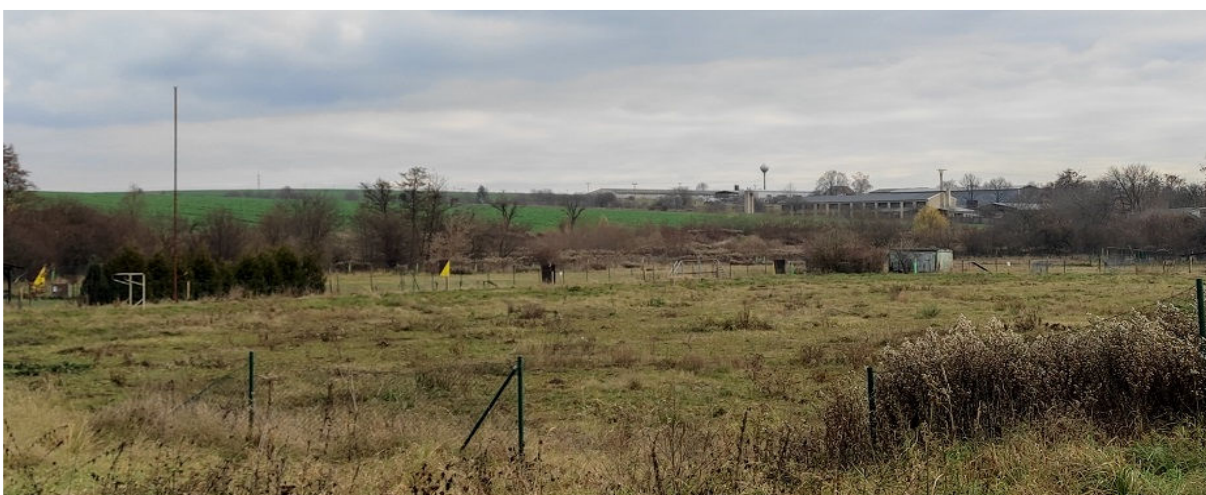
Obrázek 8.1: Pohled ze severu přes fotbalové hřiště na vodojem na východě obce (IRI)