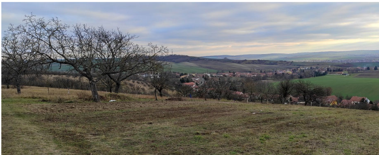
Obrázek 11.2: Pohled z přírodní památky Mrazový klín směrem k Němčanům (IRI)