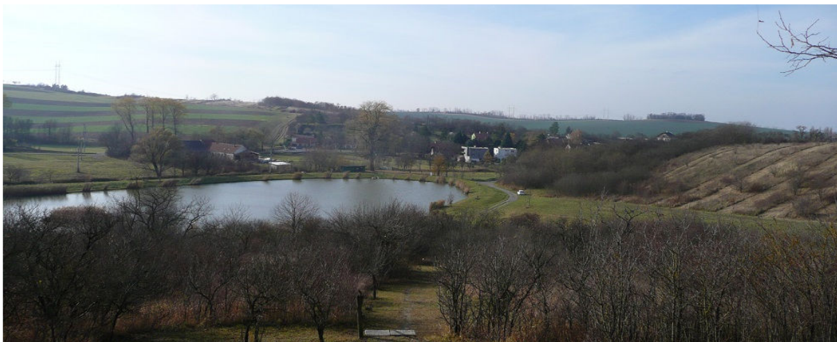
Obrázek 13.3: Výhled od altánku sv. Huberta na jižní část obce s rybníkem a viditelnými protierozními opatřeními na navazujících polích (IRI)