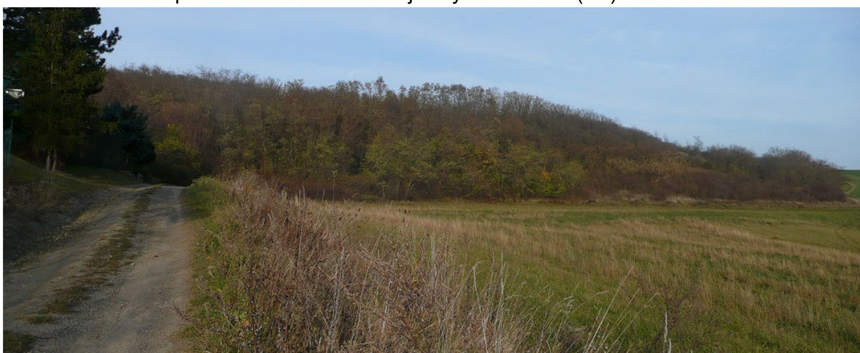
Obrázek 9.5: Polní cesta se značenou cyklotrasou na severovýchodě obce směrem na Kobeřice u Brna (IRI)