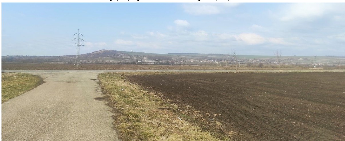
Obrázek 15.3: Výhled z cesty od léčebného zřídla „Šaratice“ na jihu obce směrem k Prackému kopci a k radaru Sokolnice (IRI)