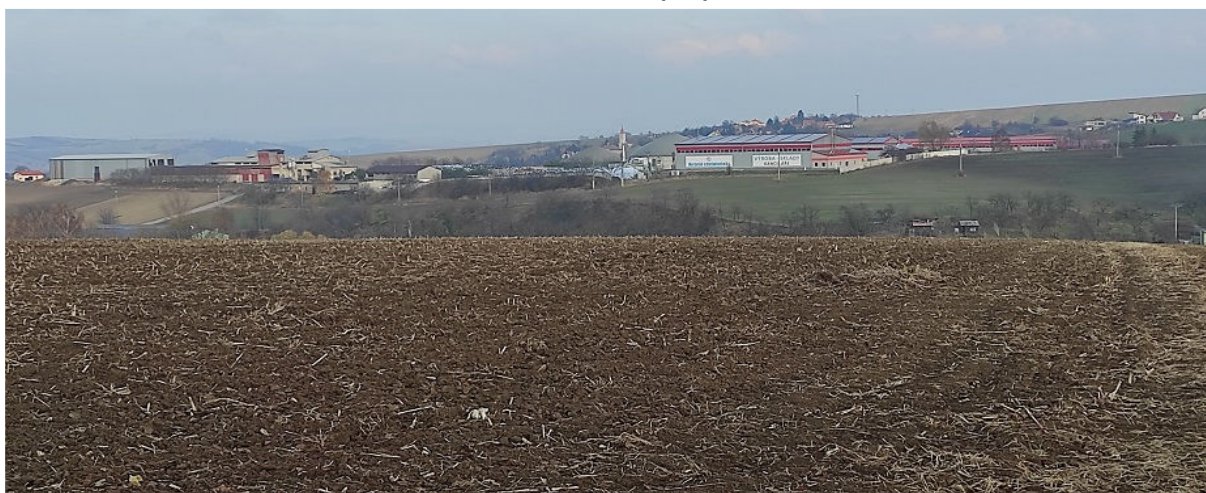
Obrázek 12.1: Pohled na Heršpice s evangelickým kostelem přes haly výrobního areálu na severu obce Nížkovice ze silnice do Slavkova u Brna (IRI)