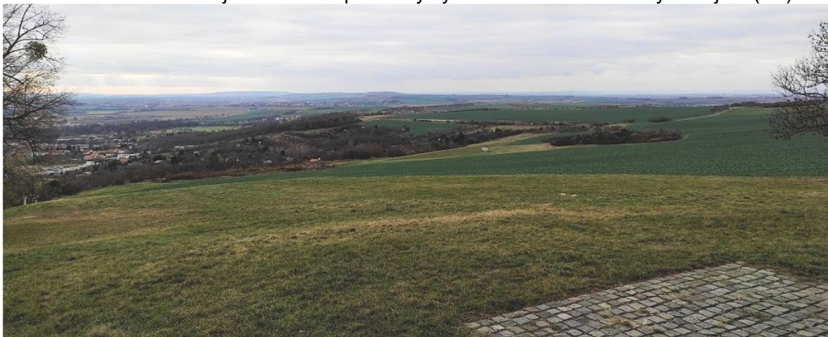
Obrázek 14.2: Výhled do krajiny a na Slavkov u Brna od kaple sv. Urbana (IRI)