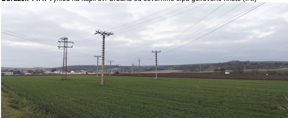
Obrázek 14.5: Pohled na město při příjezdu z Němčan s vysokou koncentrací vedení VVN (IRI)