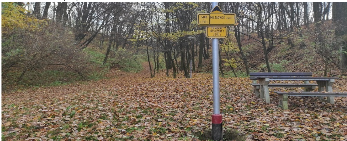
Obrázek 10.3: Pohled na vjezd cyklotrasy do krajiny na jihu obce (IRI)