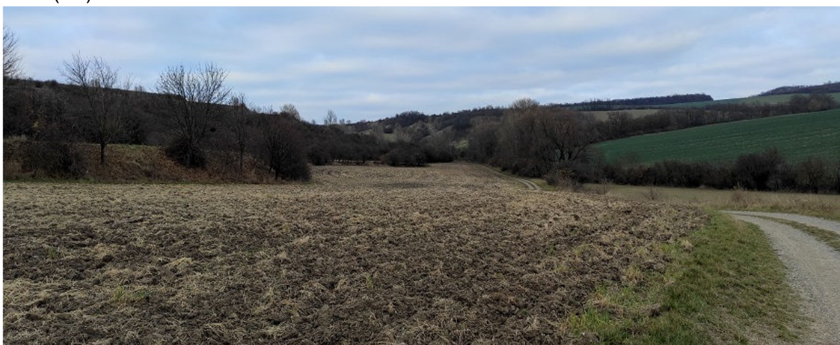
Obrázek 11.4: Pohled do krajiny od výrobně zemědělského areálu na severovýchodě obce (IRI)