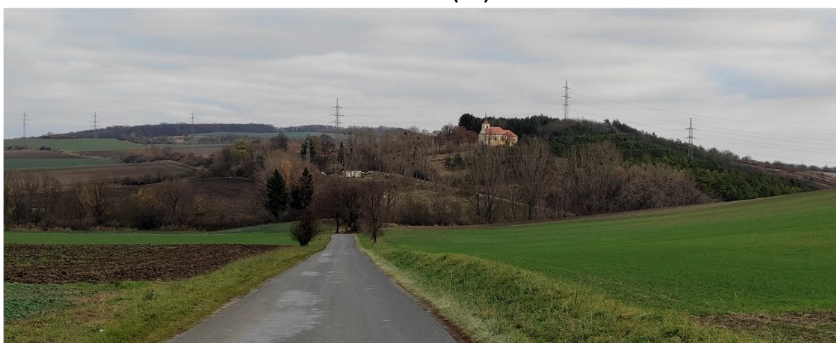
Obrázek 11.1: Výhled na poutní místo Lutřtěk ze silnice z Kroužku do Němčan (IRI)